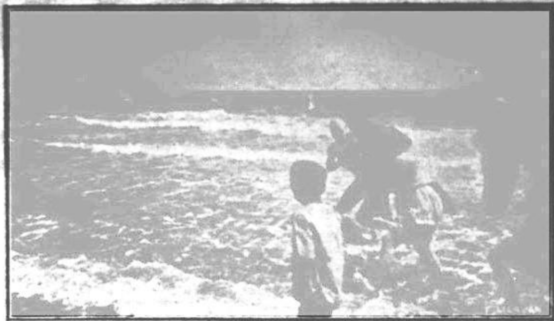
MANGALIA. — Băile populare la mare

Vizitați Băile calde MODERNE ou Vila CRISTINA In centrul stațiunii Techirghiol-Băi Confort ultra modern. Parc în curte — Apă Lumină Electrică dela uzină Proprie